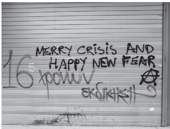
Athènes, décembre 2008