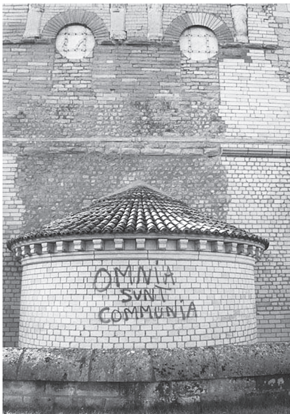
Poitiers, baptistère Saint-Jean, 10 octobre 2009