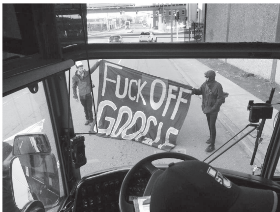
Oakland, 20 décembre 2013