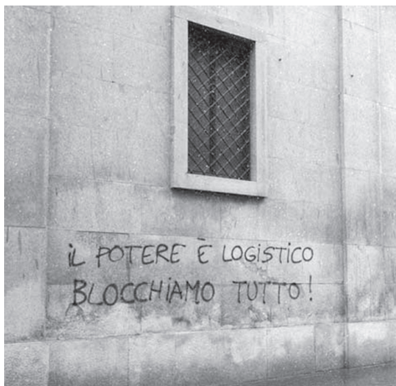
Turin, 28 janvier 2012